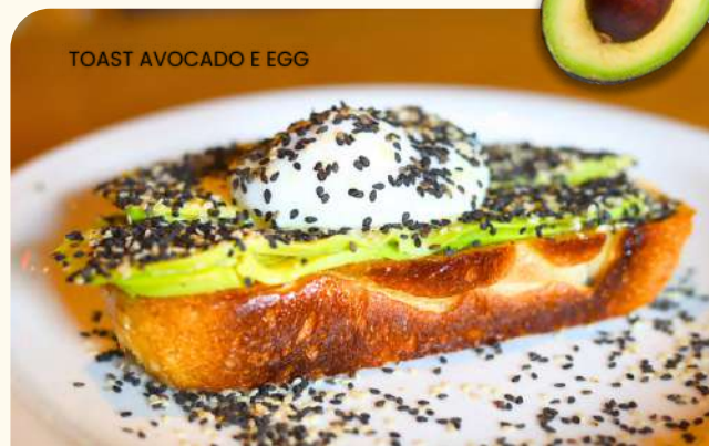
TOAST AVOCADO E EGG

3772 1 fatia de pão de fermentação natural, com fatias de abacate, limão espremido, manteiga, 1 ovo estrelado ou 1 ovo pochê e gergelim.