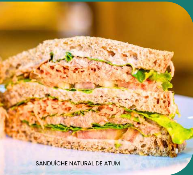
SANDUÍCHE NATURAL DE ATUM