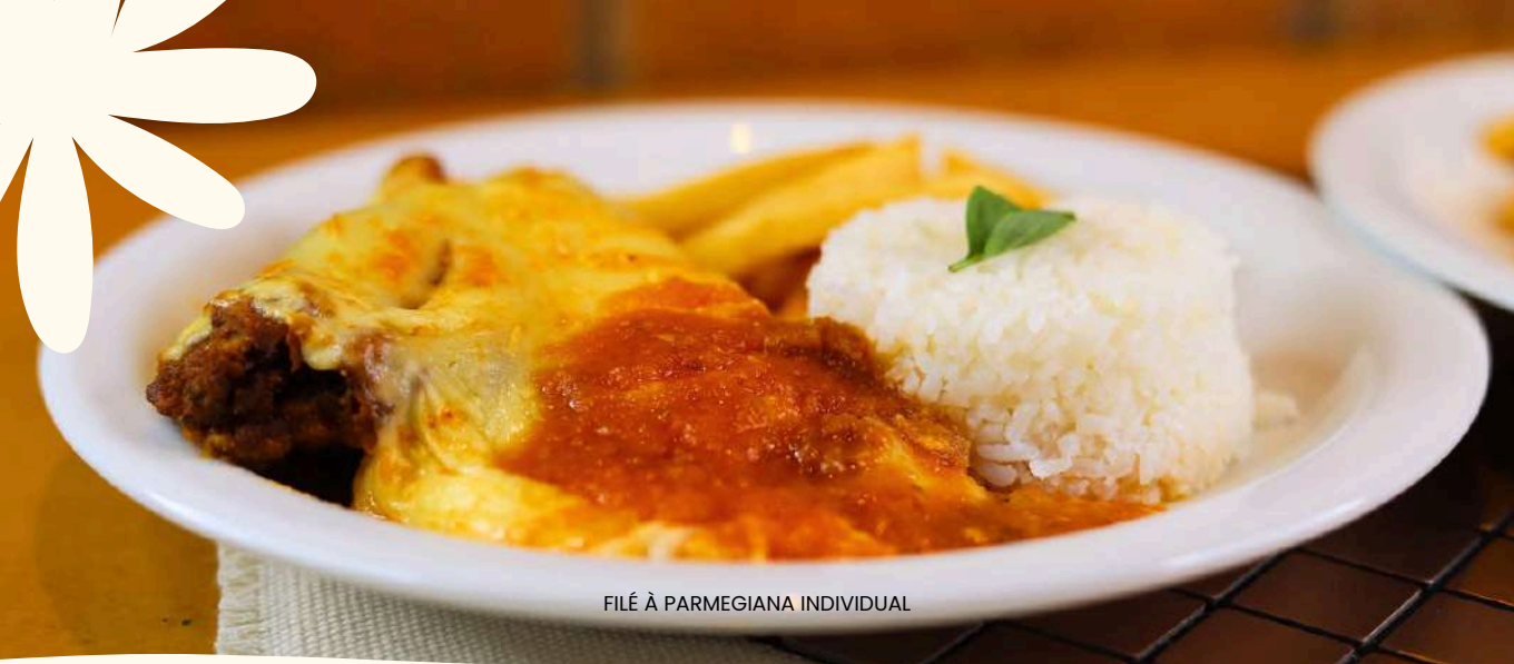
FILÉ À PARMEGIANA INDIVIDUAL